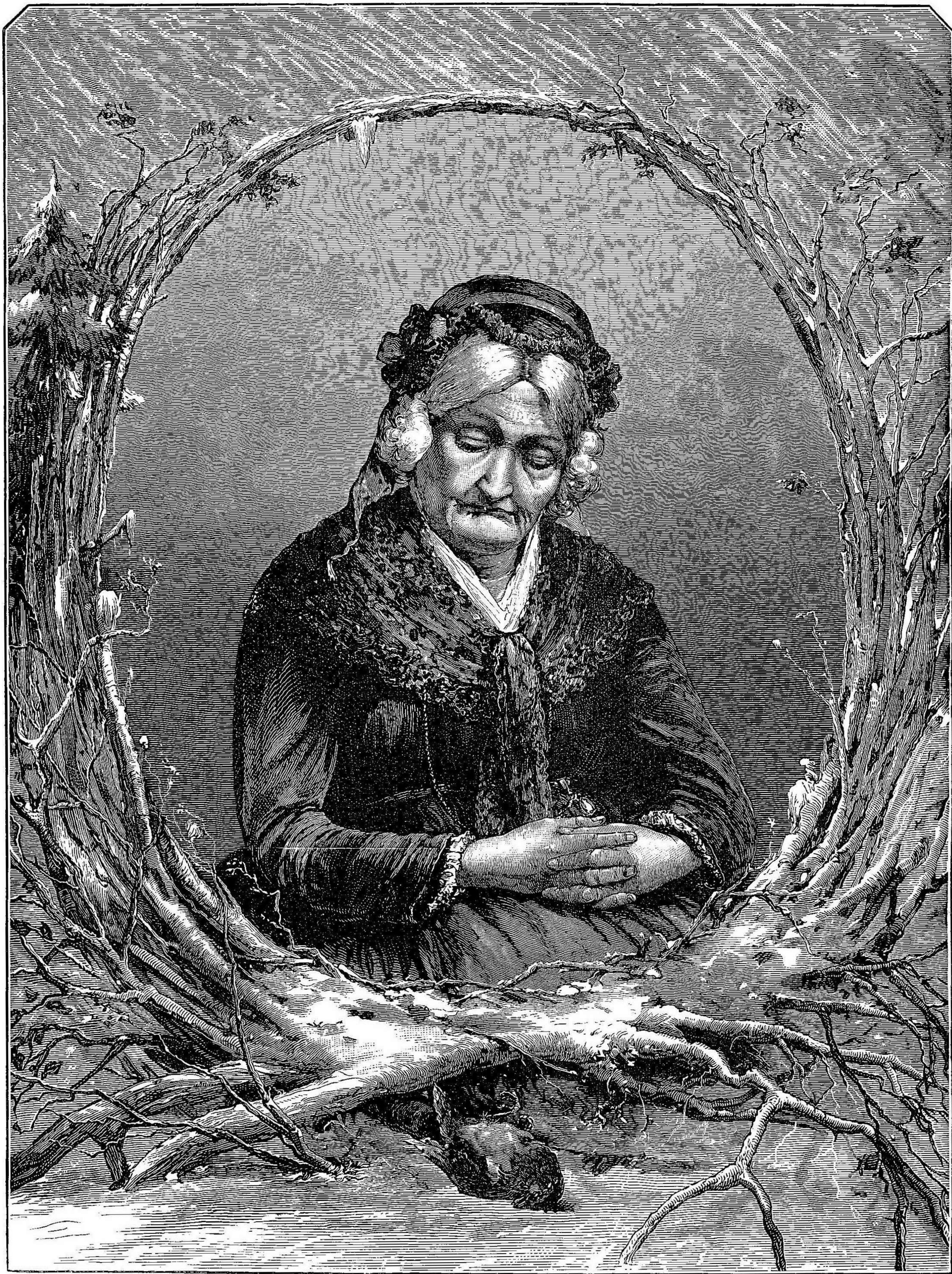
L'HIVER DE LA VIE.

Plus tard, voyant qu'un concours inoui de circonstances rendait probable la condamnation